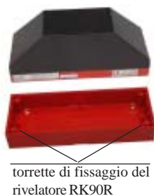
torrette di fissaggio del rivelatore RK90R

ZC-01 - E' disponibile come elemento opzionale lo zoccolo ZC-01 che facilita l'installazione nel caso in cui il cavo di collegamento viaggia entro tubo guida all'esterno della parete. Lo zoccolo ZC-01 è provvisto di fori sfondabili sui lati.